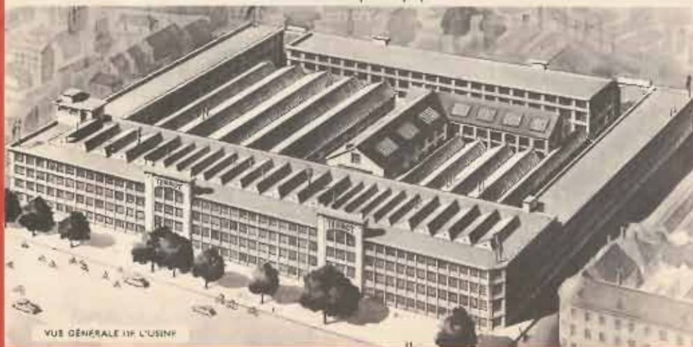
VUE GÉNÉRALE DE L'USINE

Dans la catégorie militaire, TERROT enlève les premières places des classements individuels et par équipes.