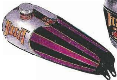
N° 54 — Chrome, noir et vermillon

(Supplément pour chromage du Réservoir : 50 f.)