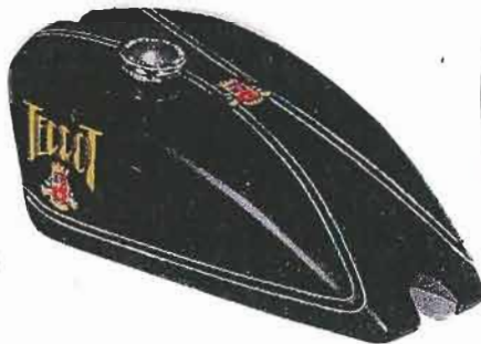
N° 11 — Noir et filets argent

Supplément pour une deuxième couleur : 15 f.