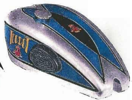
N° 64 — Chrome, noir et vermillon

Décor présenté au Salon 1932 sur tous les Modèles