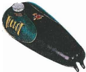
N° 50 — Noir et vert atlantique