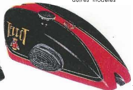
N° 14 — Noir et vermillon

Supplément pour une deuxième couleur : 15 f.