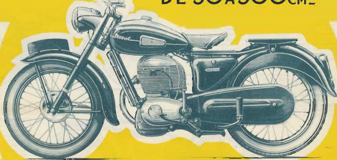
250 cm 3 type OSSD

CONSTRUIT EN GRANDE SÉRIE TOUTE LA GAMME DES MOTORISÉS DE 50 A 500 CM 3