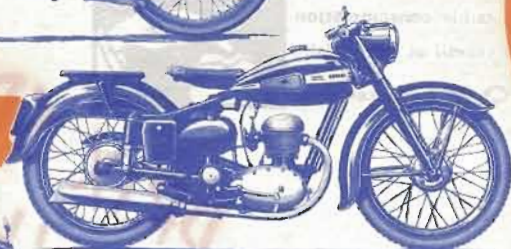
125 cm 3 Type ETDS

Type ETDS : Bloc mot. 4 t., soup. en tête, com. par culb., graiss. à circ. cont. et carter sec par pompe à double engren., allum. dynamo-batt., avance autom., freins tamb. 130 mm à double enjoliv. de moyeux polis, moyeux AR à broche, fourche télesc. à amortiss. hydraul. à double effet, suspens. AR oscill. à amortiss. hydraul., selle caout. susp., porte-bagages, cache-bat., garde-boue profonds très envelopp., réservoir. ess. 10 lit., réservoir. huile 3 lit., écl. par dyn. en bout d'arbre et batt., avertiss. élect., indic. de vit. incorp. dans le phare. Poids : 97 kgs.