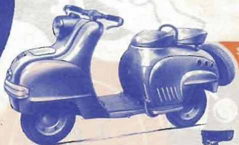
SCOOTERROT 125 cm 3 3 vitesses