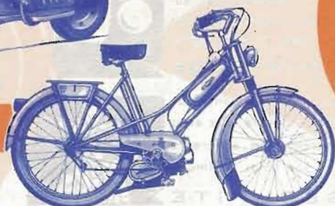
LUTIN LUXE 50 cm 3

LUTIN GRAND LUXE : Bloc-moteur 2 t., 48 cm 3 , 2 vit., fourche télesc., cadre renf. ent. par chaîne. Poids env. 40 kgs, vit. 40 km/h., cons. 1,8 l. aux 100 kms.