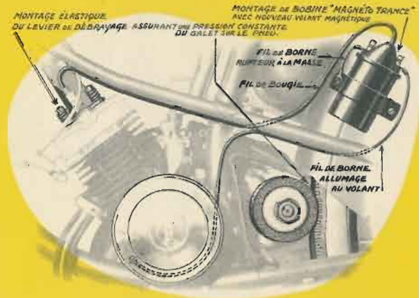
MONTAGE DE BOBINE "MAGNÉTO TRANCE" AVEC NOUVEAU VOLANT MAGNÉTIQUE DU GALET SUR LE PNEU.