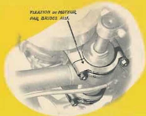
FIXATION DU MOTEUR PAR BRIDES ALL.