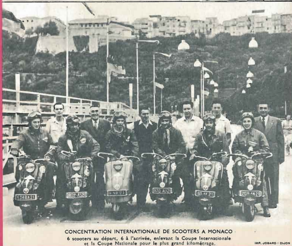
CONCENTRATION INTERNATIONALE DE SCOOTERS A MONACO 6 scooters au départ, 6 à l'arrivée, enlevant la Coupe Internationale et la Coupe Nationale pour le plus grand kilométrage.